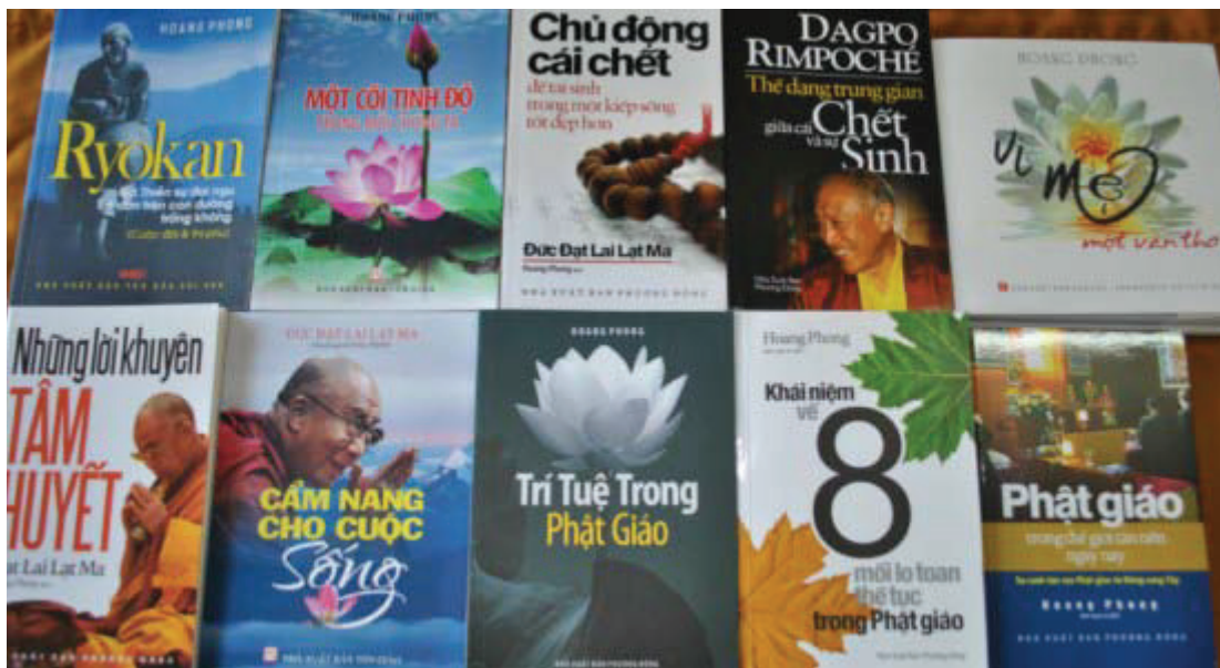
Những đầu sách và CD Phật giáo của dịch giả Hoang Phong gửi tặng TVHS