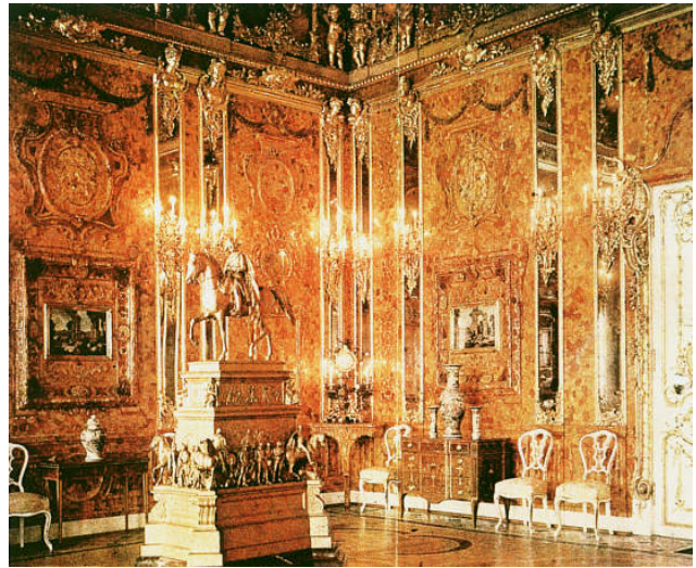
Căn phòng hổ phách trước Đế nhị thế chiến

Căn phòng hổ phách là quà của vua nước Phổ Friedrich Wilhelm I tặng cho Nga hoàng Peter Đại đế trong năm 1716. Căn phòng này được kiến trúc sư và nhà điêu khắc Andreas Schlüter phác thảo.