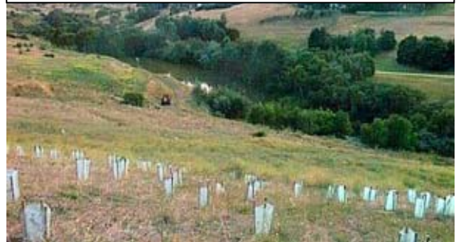
The Maribyrong from the Quang Minh Buddhist Temple at Braybrook. The river is far from rehabilitated but significant effort has been made to revegetate the valley with locally endemic species.

Đây là một chương trình được tổ chức hằng năm nhằm mục đích tham gia vào việc bảo vệ môi sinh trên toàn nước Úc. Năm nay Ban Tổ Chức đã hoạch định trồng 3000 cây mới để thay thế những cây đã trồng bị chết vì khô hạn trong mùa hè 2007, và phủ thêm cây xanh khu vực thung lũng quanh chùa và tạo môi trường cho những giống chim muông về sống. Buổi trồng cây năm nay đã được sự hưởng ứng đông đảo của Phật tử và cư dân tại Melbourne và quỹ Enviro Fund thuộc chính phủ Liên Bang tài trợ tiền mua vật dụng và cây con.