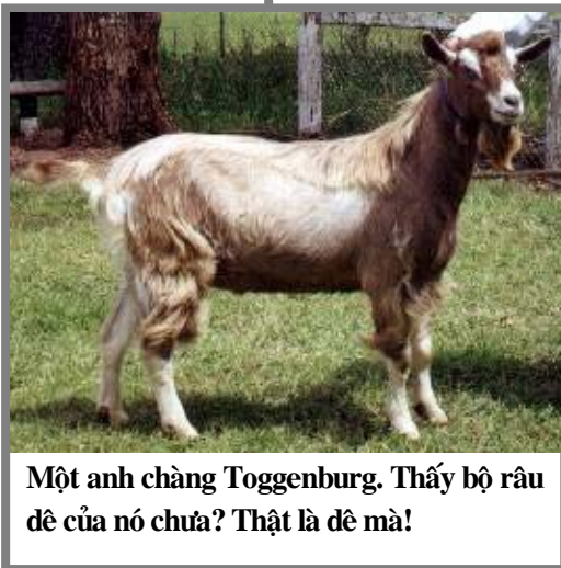
Một anh chàng Toggenburg. Thấy bộ râu dê của nó chưa? Thật là dê mà!