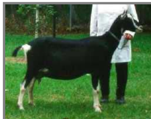
Một nàng British Alpine

Cao 83 – 95 cm Đòng họ nhà British Alpine đầu tiên