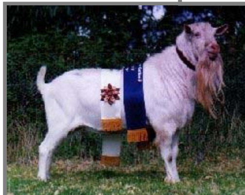
Được giải thưởng đấy! Anh chàng Saanen này được thưởng vì sau khi bị cắt cổ lột da người ta thấy anh có thịt nhiều, chất lượng cao! Con người vậy đó!

thẳng, lông màu nâu nhạt đến màu sô-cô-la, vằn trắng xuất hiện từ mắt đến mắt đến miệng, ở viền tai và trên chân từ gối đến bàn chân, trên mông và đuôi.