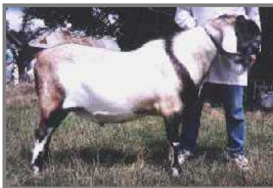
Hình bên: Chú dê đực Anglo-Nubia

tính nổi bật của giống dê Anglo-Nubia là tai hình chuông dài, mũi thẳng, đẹp, dáng đứng thẳng ngạo nghễ, ngực lớn, lưng thẳng, mông hơi gồ lên một tí. Giống dê này được nhập vào Úc từ năm 1956 và hiện có mặt ở nhiều tiểu bang. Đặc điểm khác của dê Anglo-Nubia là có nhiều mỡ và protein trong sữa, thịt được ưa thích hơn loại giống dê Thụy sĩ và có tính thích nghi nhiều với khí hậu khô nóng.