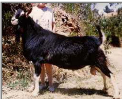
Một anh chàng British Alpine kiêu hãnh