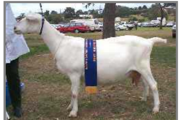
Chị Saanen này tốt số hơn! Chị được thưởng vì có sữa nhiều mà không phải bị cắt cổ lột da.

Giống Saanen được Bộ Nông nghiệp NSW nhập ở Anh và Thụy sĩ vào rồi lai giống. Sau hơn hai mươi năm thí nghiệm tại nông trại Nyngan, sau đó được tiếp tục nghiên cứu thêm ở Condobolin, ngày nay nhà họ Saanen được gắn nhãn hiệu là giòng họ dê có tầm vóc quốc gia vì đạt được nhiều kỷ