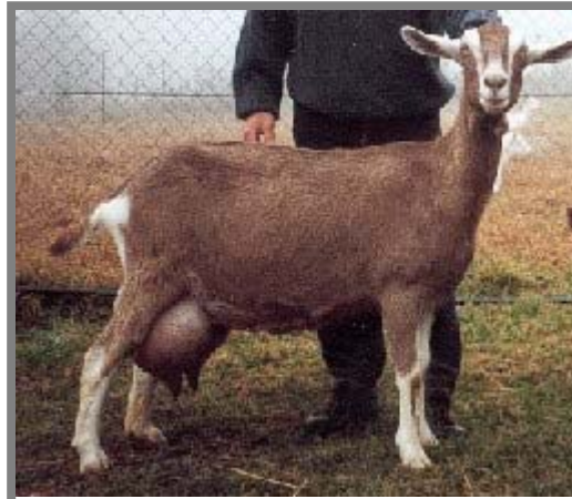
Ui chà! Nhìn bầu sữa của một chị Toggenburg thấy mà khiếp chưa chứ!

Đặc điểm: Dáng mạnh khỏe, hoạt động, nhanh nhẹn, cân đối, ngực nở, thân hình tam giác đầy đặn, xương chân khỏe và