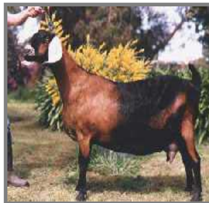
Hình trên: Con dê cái Anglo-Nubia

Kỹ nghệ nuôi dê lấy thịt và lấy sữa bắt nguồn ở Anh quốc từ thập niên 1870 từ giống dê Nubian ở Ai cập. Giống dê Jumna Pari và Chitral ở Ấn độ và giống dê Zariby Eritrea. Các giống dê này có nhiều màu, đen, nâu, có đốm. Hai đặc